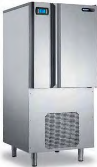
CHEF 10 RAT