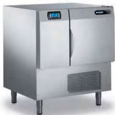
CHEF 6 RAT

Abbattitori Surgelatori / Abbattitori Surgelatori