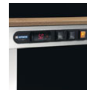
Controllo digitale Digital thermostat