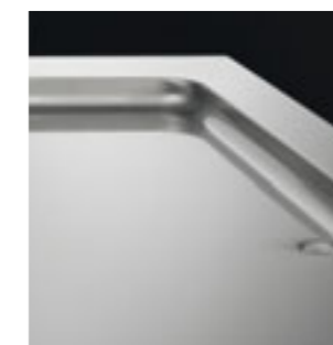
Pulizia ed igiene garantiti dal fondo arrotondato e scarico Rounded bottom and water drainage for complete hygiene