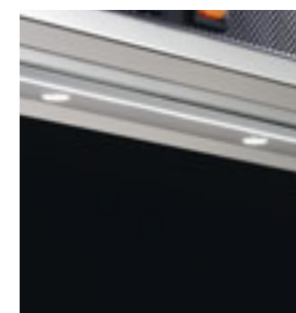
Illuminazione a led Led lighting