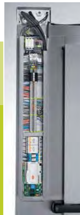
Accesso frontale facilitato ai comandi Easy access to control and power panels

Please ask for a quotation if you require blast chillers and freezers with bigger dimensions.