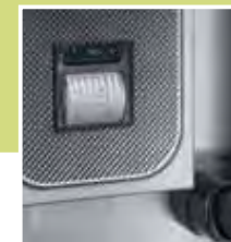
Stampante HACCP HACCP printer