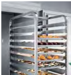
Carrello per teglie pasticceria. Euronorm trolley for confectionery products.