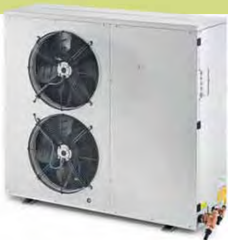
Unità frigorifere carenate e silenziate di serie Choice of outdoor noiseless condensing units