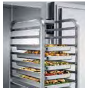
Carrello per teglie gastronomia. Gastronorm trolley.