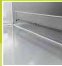
Paracolpi e angoli arrotondati. Rounded corners and protective bond