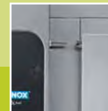
Sensore magnetico Magnetic switch