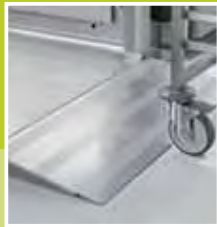
Rampa in acciaio inox antiscivolo S/s ramp