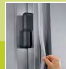
Cerniera e guarnizione Hinge and snap out door gasket