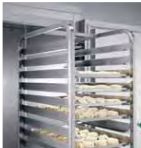
Carrello per teglie panificazione. Euronorm trolley for bakery products.