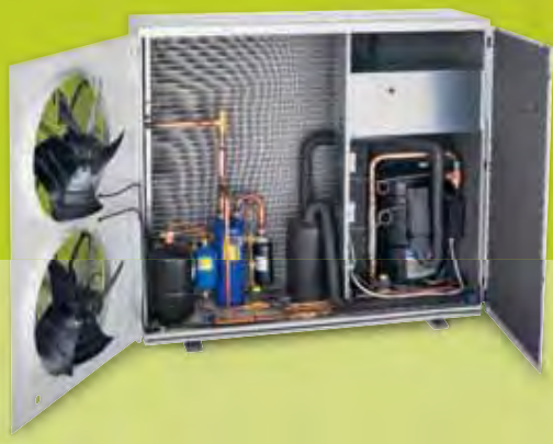
Evaporatore facilmente ispezionabile e pulibile Easy access to evaporator