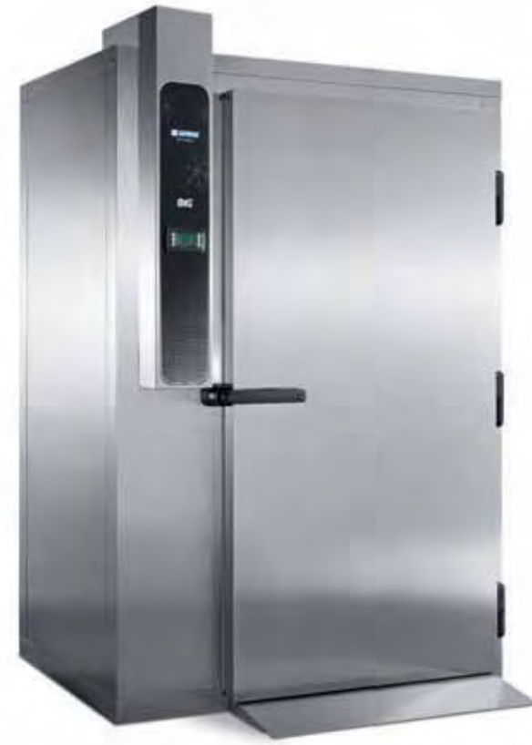
BIG CHEF 40