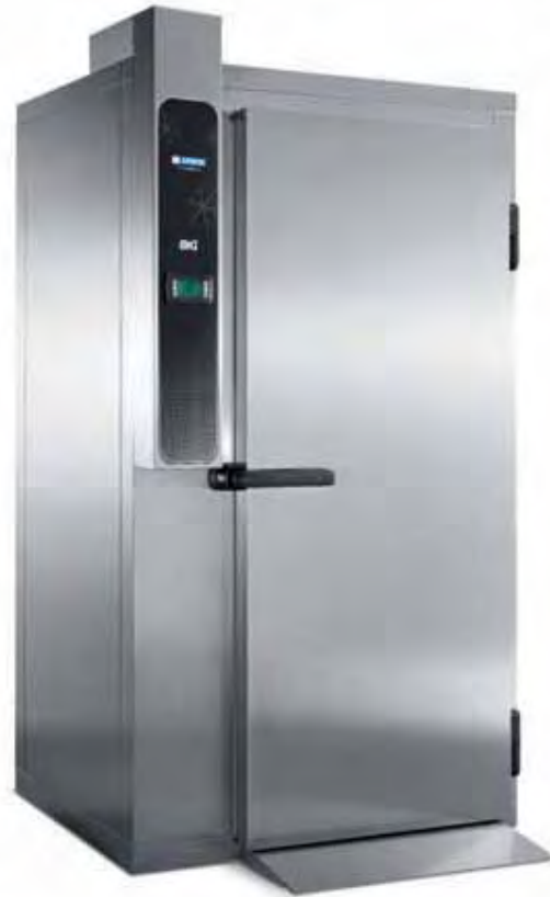
BIG CHEF 20