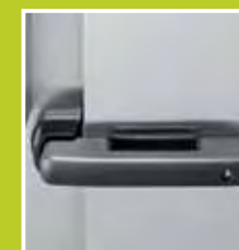
Maniglia esterna Handle