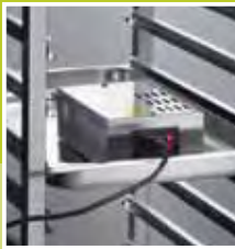
Sterilizzatore a ioni Steriliser