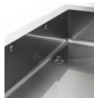
Pulizia ed igiene garantiti dal fondo arrotondato e scarico con tubo troppopieno Rounded bottom and water drainage for complete hygiene