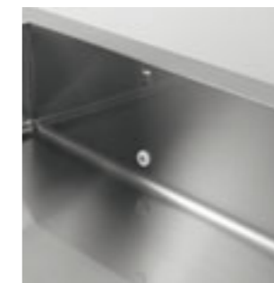
Nessuno spreco d'acqua grazie al carico automatico e controllo di livello "di serie" No water waste thanks to automatic water charge and level control