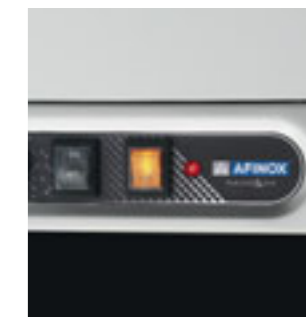
Spia rossa accesa: mancanza acqua Red warning light on: water is missing