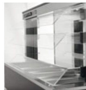
Capottina abbassabile elettricamente Electrical device for hood lowering